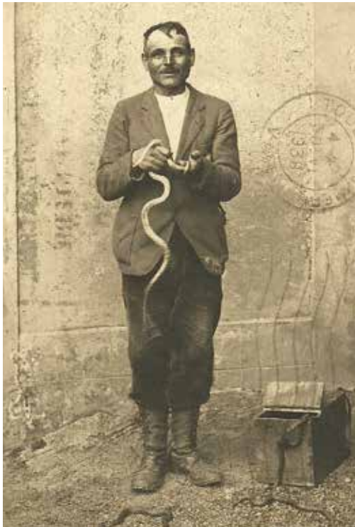
Afbeelding 2: Een onbekende adderjager gefotografeerd in de straten van Lyon. Image 2: A picture of an unknown viper hunter on the streets of Lyon.

In Villeurbanne was in de jaren 50 en 60 van de vorige eeuw de adderjager René Nonin een graag geziene verschijning. Op de wekelijkse markt in deze voorstad van Lyon verscheen hij steevast met zijn kraampje geheel gewijd aan de jacht op adders.